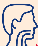
Koo ya kuumwa