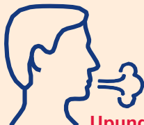
Upungufu wa pumzi